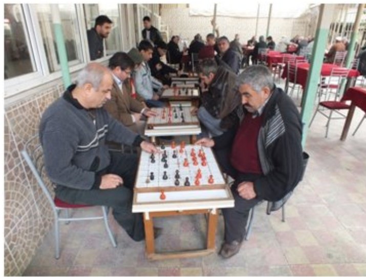
(Fot.1: Bülent Ayberk, 2014)

Dama oyuncularının kahvehane içinde yerleşmiş oldukları bölüm; oyun masası, sandalyeler ve ara birim olan sehpadan oluşan oyun biriminin yinelenmesiyle, doğrusal olarak oluşmuştur (Fot.1). Burada, diğer masa oyun türlerinin de yer aldığı plan yerleşimi içinde; dama oyun oynama kültürünün, mekân içinde yer seçiminde ve yerleşimdeki etkisi gözlenebilmektedir (Fot. 2).