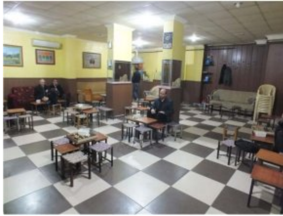
(Fot: 10: Bülent Ayberk, 2014)

467. sokakta yer alan Yaşar Çay Evi'nde diğer dama oynanan mekânlardan farklı olarak doğrusal bir düzen değil; sehpanın etrafına konumlanan kürsülerle oluşturulan noktasal bir yerleşim görülmektedir. Bu oyun birimi, sehpa ve kürsülerden oluşmaktadır. Aşağıdaki görsellerde görüldüğü üzere sehpa, üzerine konulan dama tablası ile bir oyun masasına dönüşmektedir (Fot.10). Geniş oyun mekânının duvarları boyunca yerleştirilen kanepelerle sehpa ve kürsü bir araya getirilerek yeni bir modül oluşturulmuştur. Bu birim, yukarıda Bursa'da bulunan kahvehanelerin mekânı anlatılırken değinildiği üzere; halk arasında "ranza" olarak adlandırılan oturma mobilyasının ve oturma biçimi kültürünün (Fot. 8) günümüzde üretilen mobilyalarla karşılanarak oluşturulmuş bir yorumudur.