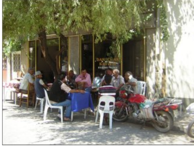
(Fot.27: Bülent Ayberk, 2014)

Tire’deki diğer kahvehanelerde de dama masaları bulunmakta; oyun oynamak isteyenler bu masalardan yararlanabilmektedir.