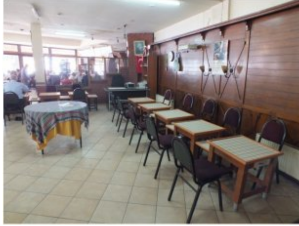
(Fot.16: Bülent Ayberk, 2012)

Dama turnuvalarının da düzenlendiği kiraathane, böyle zamanlarda yoğun bir oyuncu kitlesini ağırlamaktadır. Görsellerde görülen dama masalarının (Fot.16) turnuva zamanlarında sayıca yetersiz kalması nedeniyle İzmir Damacılar Derneği tarafından yaptırılan taşınabilir dama oyun yüzeyleri (Fot.17), var olan diğer oyun masalarının üzerinde kullanılmaktadır. Bu durum birbirinden farklı kullanım biçimlerini bir araya getirmektedir.