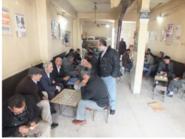
(Fot.4: Bülent Ayberk, 2014)

Aşağıdaki görsellerde yer verilen Keklikçiler Kahvesi (Fot.4), Petrol Çayevi (Fot.5), Dostlar Çayevi'nde (Fot.6) gözlenebileceği üzere doğrusal ve noktasal yerleşim biçimi kullanılabilmektedir. Ayrıca oturma kültürünün biçimlendirdiği oturma mobilyası ve buna bağlı olarak oyun masası ile arasındaki biçimsel ve oransal ilişki bir dama oyun birimi tipolojisi ortaya çıkarmaktadır.