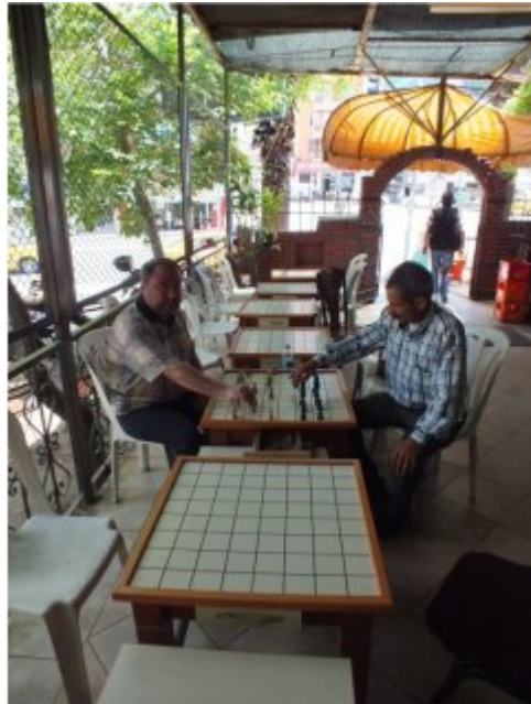
(Fot.15: Bülent Ayberk, 2012)

Konak ilçesi sınırları içerisindeki Eşref Paşa semtinde bulunan damacılar kahvesi özelleşmiş bağımsız bir mekân olarak değil; kiraathanenin bir parçası olarak kullanılmaktadır. İzmir'li usta dama oyuncularının uğrak yeri olan bu mekân, İzmir'li dama topluluğunun merkezi olarak kullanılmaktadır. Teras bölümü tüm mevsimlerde etkin olarak kullanılmaktadır (Fot.15).