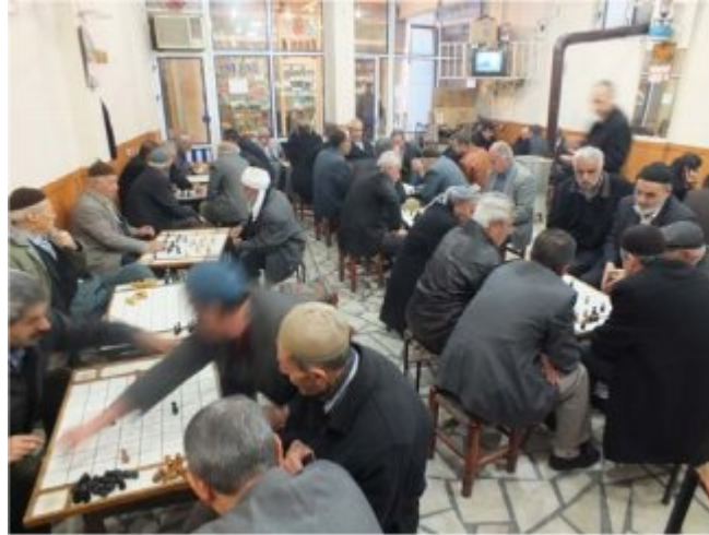
(Fot. 3: Bülent Ayberk, 2014)

Yalnızca dama oynanan kahvehane kalabalık bir oyuncu kitlesine sahiptir. Doğrusal bir yerleşimin egemen olduğu bu planlama, oyun kültürünün etkisi ile ihlal edilebilmektedir. Rakip oyuncuları izlemek amacıyla toplanan izleyicilerin yoğun müdahalesi ve oyuna katılım alışkanlıkları dama masası merkezli toplanmalara neden olmaktadır (Fot.3). Bu durum, doğrusal dizilimin dağılmasına neden olabilmektedir.