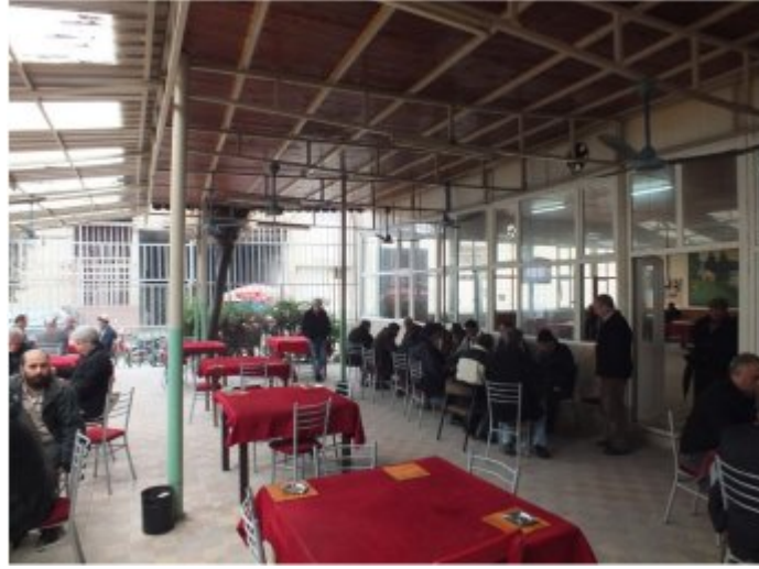
(Fot.2: Bülent Ayberk, 2014)