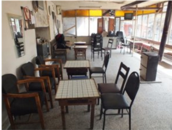
(Fot.13: Bülent Ayberk, 2012)

Kahvehanenin uygun mevsimlerde kullanılan dikdörtgen plana sahip bir açık alanı ve aşağıda görsellerine yer verilen kapalı mekânı bulunmaktadır. Doğrusal olarak bir araya gelen dama masaları, mekânın kullanımını etkileyen en önemli etmendir (Fot.13).