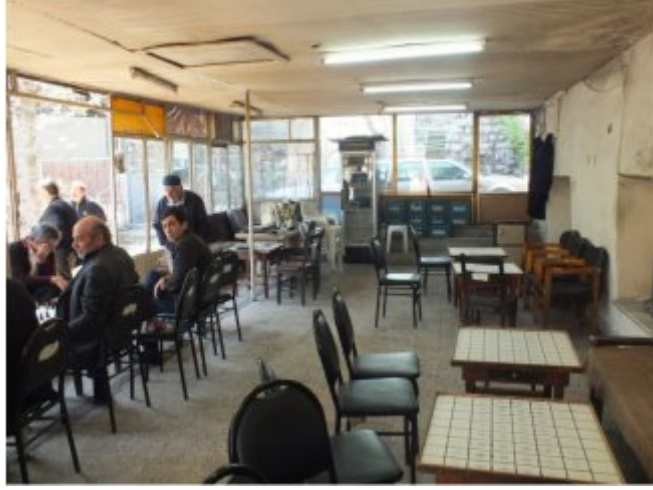
(Fot.14: Bülent Ayberk, 2012)

Türkiye'nin pek çok yerinden gelerek İstanbul'a yerleşen yurttaşların dama oynadığı bu mekânda - oyuncuların kültür ve beden ilişkisinden kaynaklanan farklı oturma alışkanlıklarına karşın - oturma birimi olarak sandalye kullanılmaktadır (Fot.14). Bu birim, mekândaki oyun masasının yükseklik ve genişlik ölçülerini etkilemesi bakımından da önemlidir. Sandalye kullanımı ile birlikte antropometrik ve algısal gereksinimler oyun masasının da oranlarını farklılaştırmıştır.