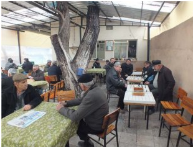
(Fot.22: Bülent Ayberk, 2013)

İzmir Menemen’de Kılıçarslan Sokak’ta yer alan kahvehane metal konstrüksiyon ve branda gibi hafif malzemeler kullanılarak kurulan geçici bir mekân görünümündedir. Mekân içinde noktasal olarak konumlandırılan diğer oyun masaları arasında doğrusal bir konumlandırma ile dikkat çeken dama masaları, yerleşim hiyerarşisi içinde ikincil bir durumda bulunmakla beraber, oyunun gereksinimleri nedeniyle mekânın plan olarak örgütlemesine bir örnek oluşturmaktadır (Fot.22).