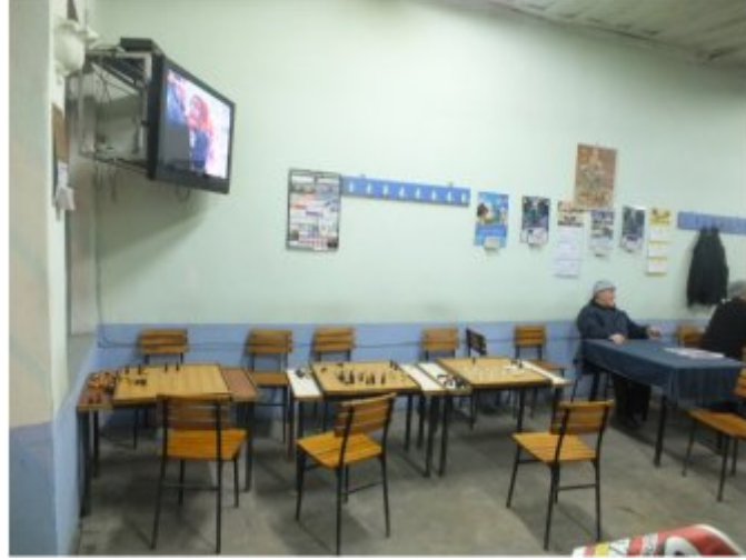
(Fot.23: Bülent Ayberk, 2013)

Mustafa Kemal Paşa, "Damanın Kırkpınarı" sloganı ile Türkiye'nin en köklü dama turnuvasına ev sahipliği yapmaktadır. Burada bulunan Asmalı Kahvehane olarak adlandırılan dama kahvehanesi, kentin bu özelliğine koşut bir biçimde kültürel olarak önemli bir konum yüklenmektedir. Burada diğer kahvehanelere benzer biçimde doğrusal bir yerleşim görülmektedir (Fot.23). Ancak dama masalarının biçimi ve ayrıntıları dikkat çekicidir. Burada karşılaşılan dama masası ve çevresel elemanlarının bir bütünde toplanarak, üreticinin yorumu ile ne kadar farklılaşabildiği ve başarılı ürünler ortaya çıkabileceğinin çarpıcı bir örneğidir.