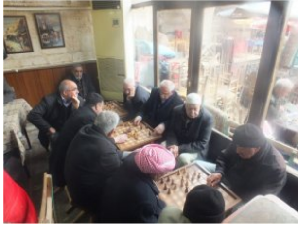
(Fot.25: Bülent Ayberk, 2014)

Gümrük Han, 1563 yılında Urfa Sancak Beyi Halhallı Behram Paşa tarafından yaptırılmıştır (URL-3). Yaz mevsiminde handa bulunan geniş avlu, kahvehane oyuncuları tarafından kullanılmaktadır. Burada kahvehane olarak işlev gören mekân içinde farklı türde masa oyunları oynanmaktadır. Dama oyuncularının oturma birimi olarak özellikle kürsüyü tercih etmesi, ayrılan bu bölümü farklılaştırmaktadır (Fot.25). Burada da benzer biçimde sehpalara koyularak oyun birimlerine dönüştürülen oyun masaları bulunmaktadır (Fot.26).